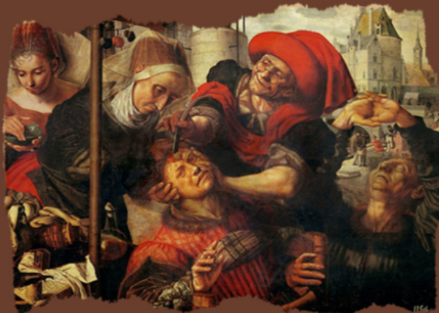
Removing a Stone. Jan Sanders van Hemessen, s XVI.

“La nueva legislación italiana para tratamiento ambulatorio de los ofensores no imputables”